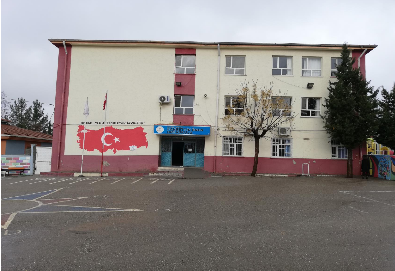
Okulumuzun genel görünümü